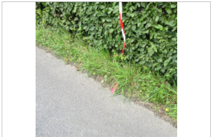
Vue rapprochée de la rubalise qui signale la laisse de crue

MARQUE Maximum de l'inondation : Non renseigné Visibilité : Oui État du repère : Mauvais Pérennité : Aucune