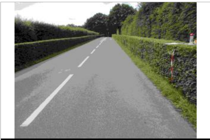
Vue d'ensemble de la laisse de crue.

GÉOLOCALISATION Coordonnées WGS84 : X: 0.12128435 / Y: 48.43362620 Coordonnées RGF93 (Lambert 93) X: 487110.68 / Y: 6818697.28 Coordonnées RGF93 (ETRS89) : X: 0.1212844 / Y: 48.4336262 Code Hydro: M---0060 Rive de référence: Gauche