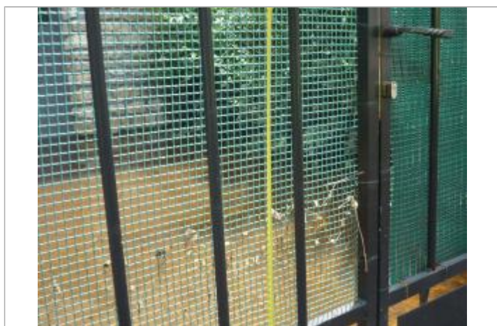
Vue rapprochée de la laisse de crue

Altitude calculée de l'eau (en m) : 132.62