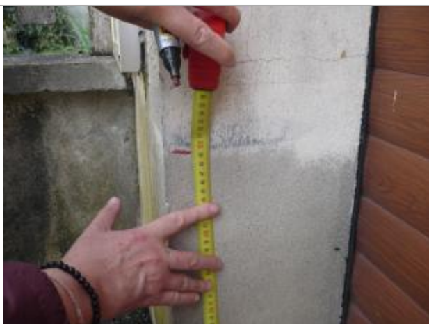
Vue rapprochée de la laisse de crue

Altitude calculée de l'eau (en m) : 132.6 m