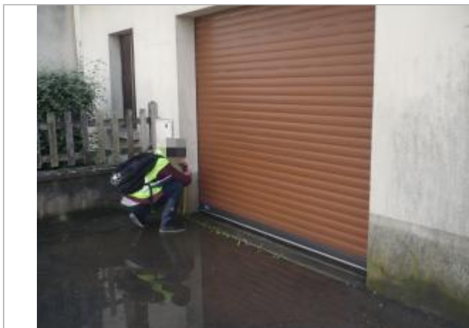
Vue d'ensemble de la laisse de crue.

Coordonnées WGS84 : X: 0.11635875 / Y: 48.43616740