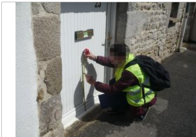
Vue d'ensemble de la laisse de crue.

Coordonnées WGS84 : X: 0.11623671 / Y: 48.43619110