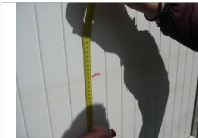
Vue rapprochée de la laisse de crue