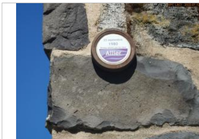
Vue du repère rapprochée