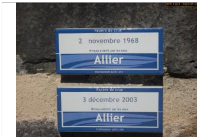
Vue du repère rapprochée