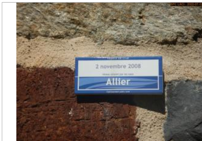
Vue du repère rapprochée