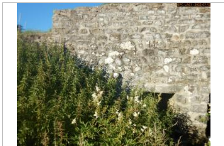
Vue du repère éloignée