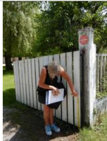
Vue d'ensemble de la laisse de crue sur portail (Source : DDT 61).