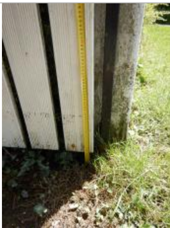
Vue rapprochée de la laisse de crue

Altitude calculée de l'eau (en m) : 131.57 m