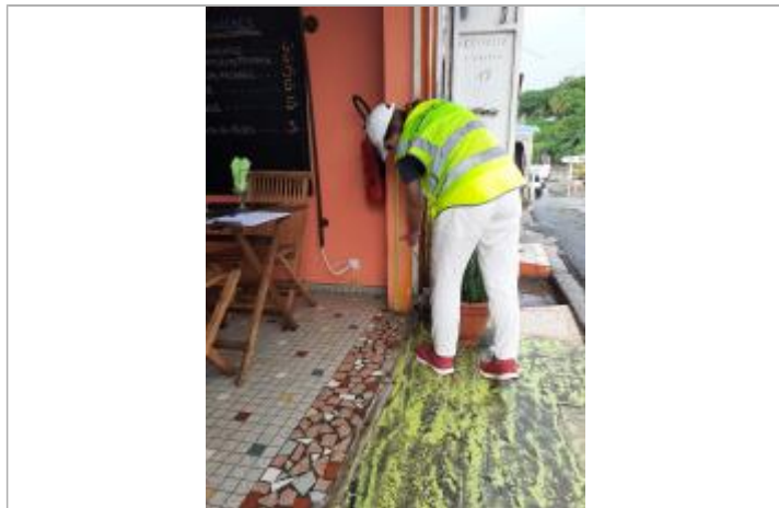
Témoignage d'une hauteur d'eau

Altitude calculée de l'eau (en m) : 4.521