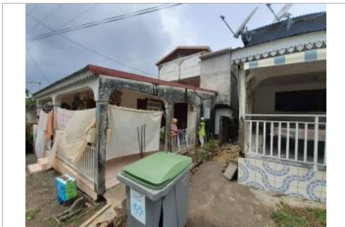
Terrasse extérieure de la maison