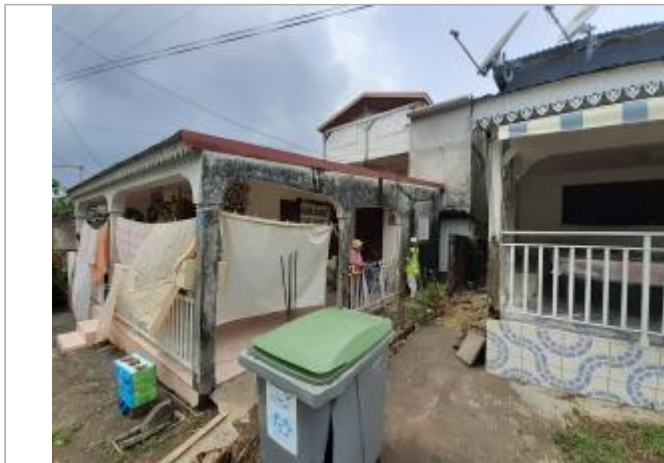
Terrasse extérieure de la maison