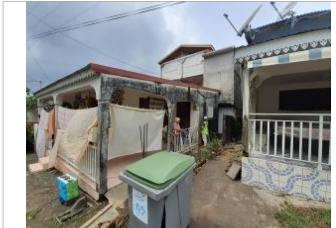
Terrasse extérieure de la maison