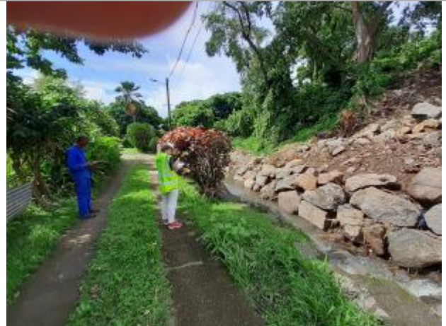
Rive droite de la ravine du bourg