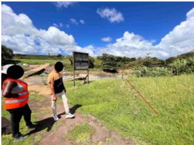
Dépôt de matières solides indiquant l'emprise de la zone inondée en rive droite

Type de repérage : Campagne de terrain post-inondation