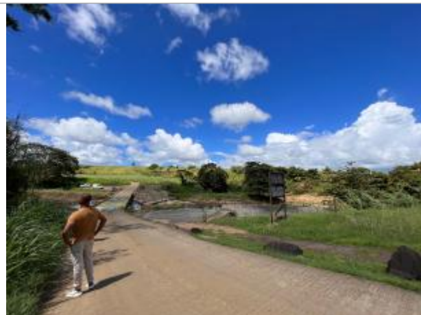
Photo du Pont qui enjambe la Grande Rivière de Goyave sur le chemin de Chouchou depuis l'aire de pique nique