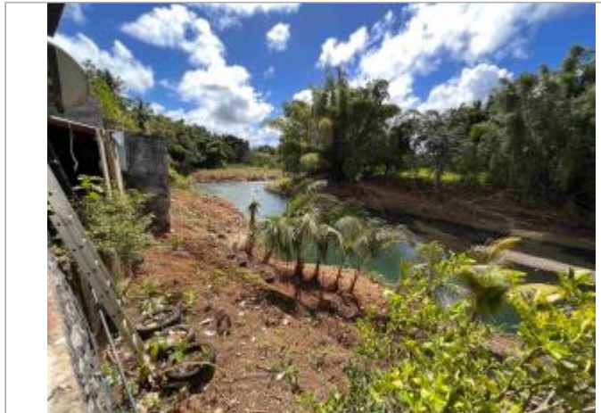
Façade extérieure de la maison

Coordonnées WGS84 : X: -61.66856600 / Y: 16.23209300