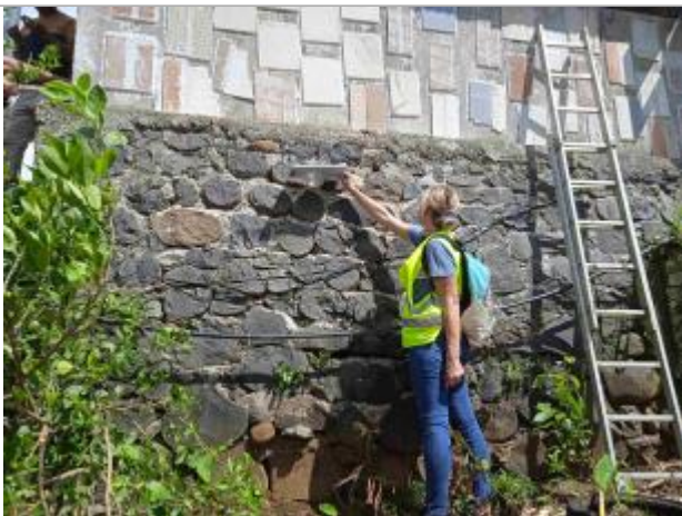
Témoignage d'une hauteur d'eau

Différence entre le niveau d'eau et la référence (en m) : -0.370 m