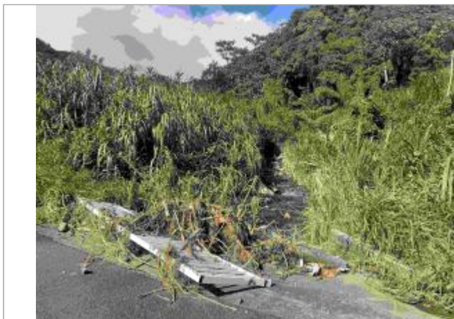
Ouvrages de protection cassés à l'amont du pont