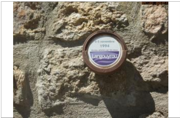
Vue du repère rapprochée

MARQUE Texte : 4-5 novembre 1994 Maximum de l'inondation : Oui Visibilité : Oui État du repère : Bon Pérennité : Longue Repère calculé : Oui PHEC : Oui