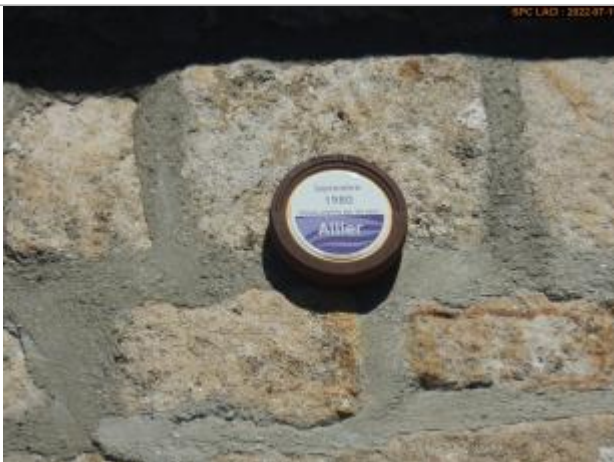
Vue du repère rapprochée