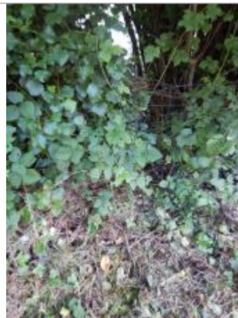
Vue d'ensemble du grillage en fond de cour, proche de la Sarthe.