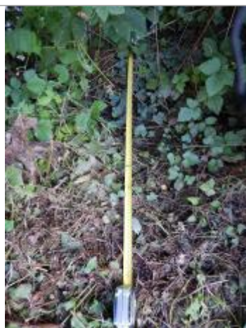
Vue rapprochée de la laisse de crue