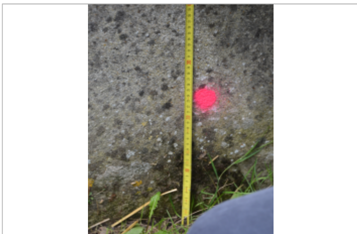
Vue rapprochée de la marque sur le mur

Maximum de l'inondation : Oui Visibilité : Non État du repère : Mauvais Pérennité : Aucune