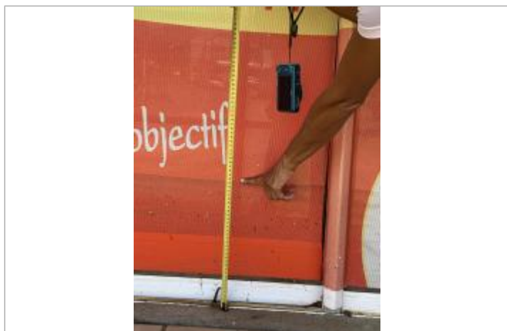
Dépôt de matières solides

Altitude calculée de l'eau (en m) : 10.897 m