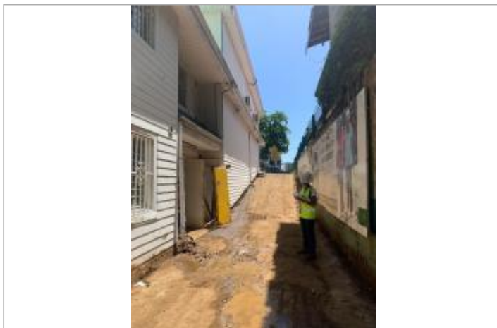
Façade extérieure du bâtiment