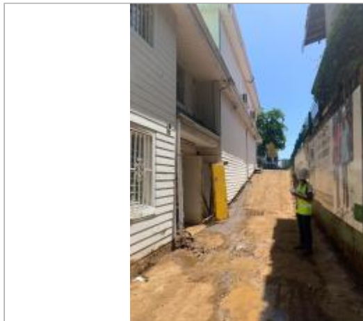
Façade extérieure du bâtiment

Coordonnées WGS84 : X: -61.56678900 / Y: 16.04023500