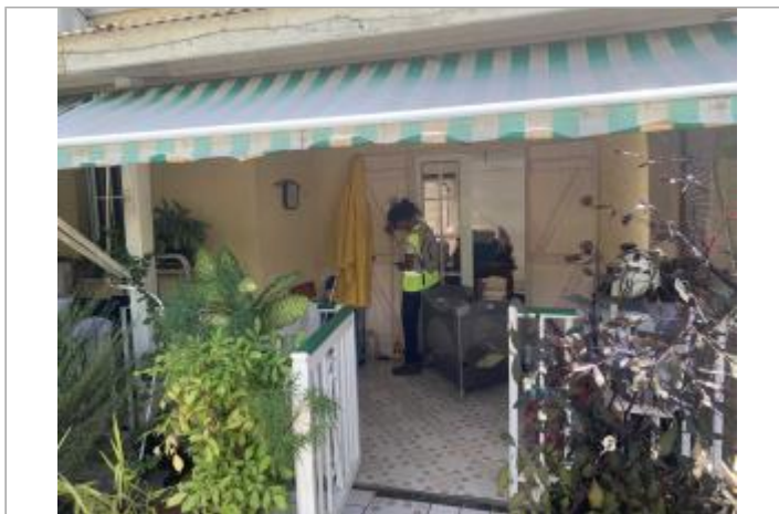
Façade extérieure de la maison