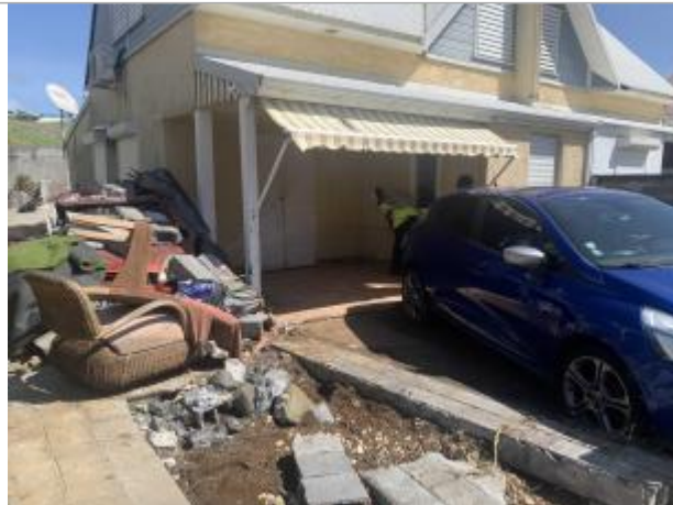
Façade extérieure de la maison