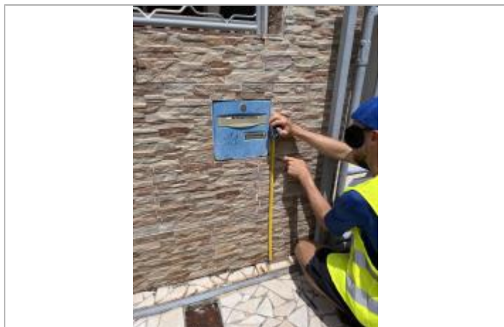
Témoignage d'une hauteur d'eau

Maximum de l'inondation : Oui Visibilité : Oui État du repère : Disparu Pérennité : Aucune