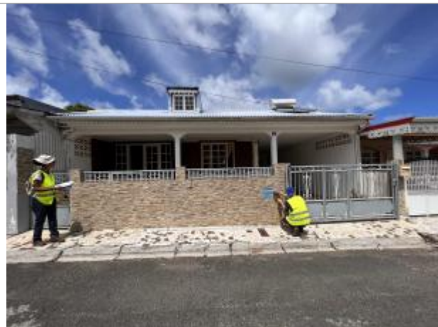
Mur de clôture