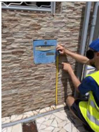
Témoignage d'une hauteur d'eau

Altitude calculée de l'eau (en m) : 18.335