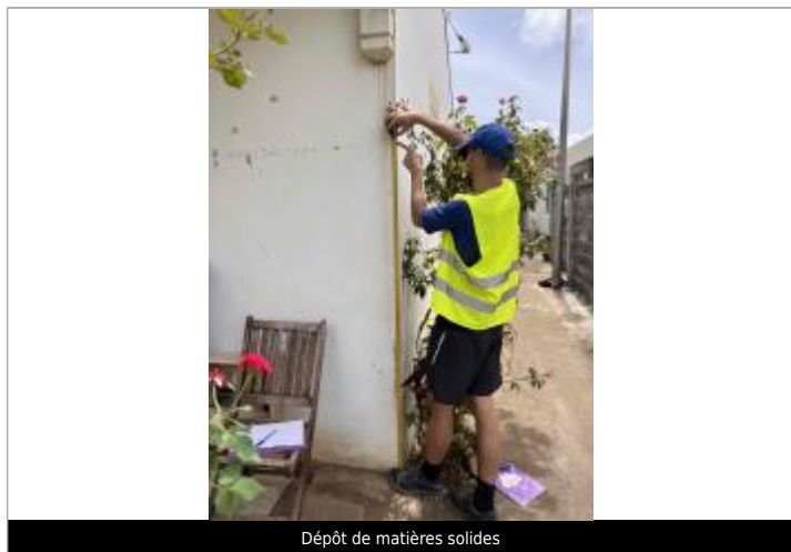
Dépôt de matières solides

Altitude calculée de l'eau (en m) : 11.677 m