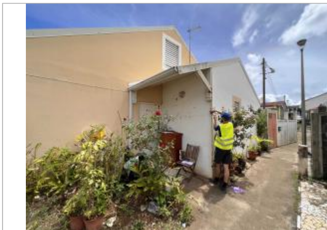
Façade extérieure de la maison

Coordonnées WGS84 : X: -61.56354000 / Y: 16.04715400