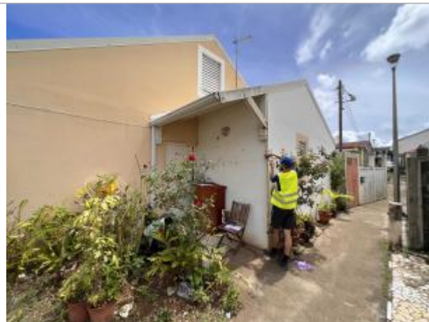
Façade extérieure de la maison