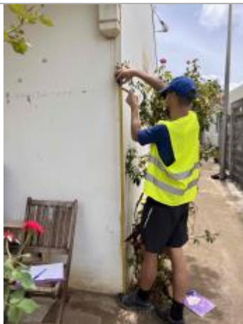
Dépôt de matières solides

Altitude calculée de l'eau (en m) : 11.677 m