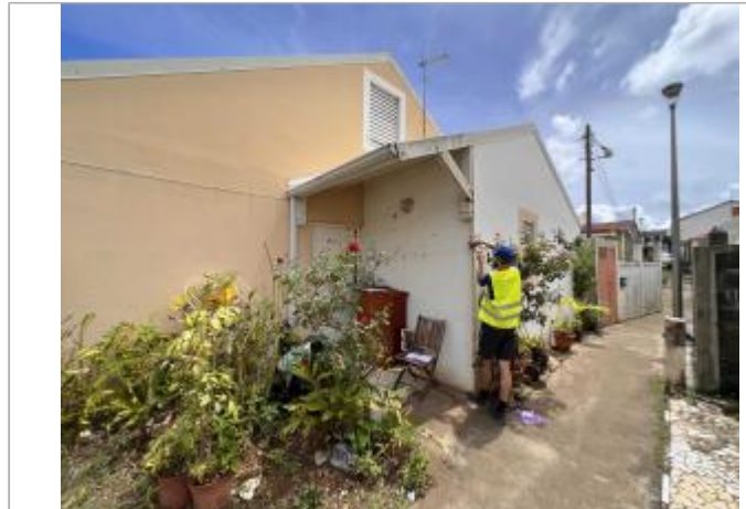
Façade extérieure de la maison

Coordonnées WGS84 : X: -61.56354000 / Y: 16.04715400