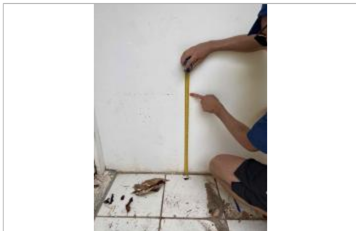
Dépôt de matières solides

Altitude calculée de l'eau (en m) : 11.787 m