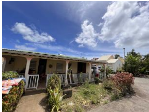
Terrasse extérieure de la maison