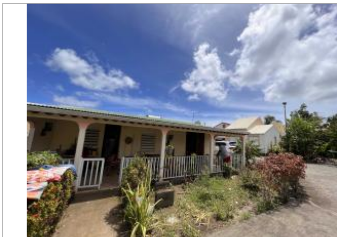
Terrasse extérieure de la maison

Coordonnées WGS84 : X: -61.56389000 / Y: 16.04719800