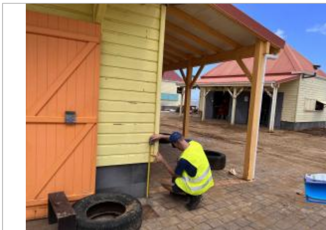
Cabane du village artisanal