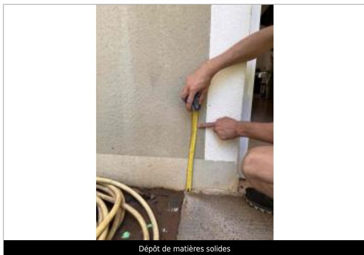
Dépôt de matières solides

SOURCE DE REPÉRAGE : CAMPAGNE DE TERRAIN POST-INONDATION (FIONA) DES AGENTS DEAL - 16/09/2022