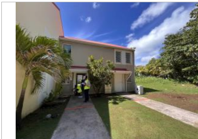
Rue Jean Jaurès