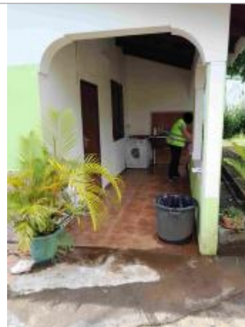
Terrasse extérieure de la maison

Coordonnées RGF93 (ETRS89) : X: -61.592097 / Y: 16.034903