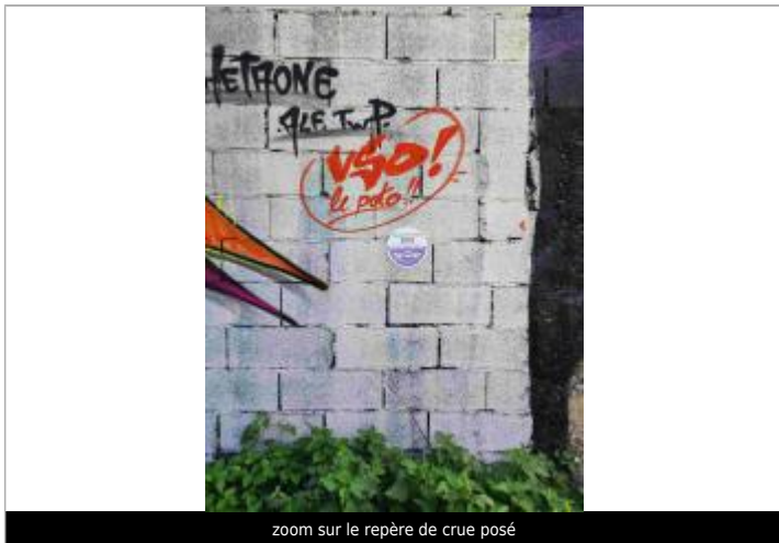
zoom sur le repère de crue posé