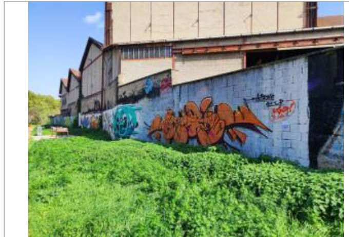
Quai eugène Souchon