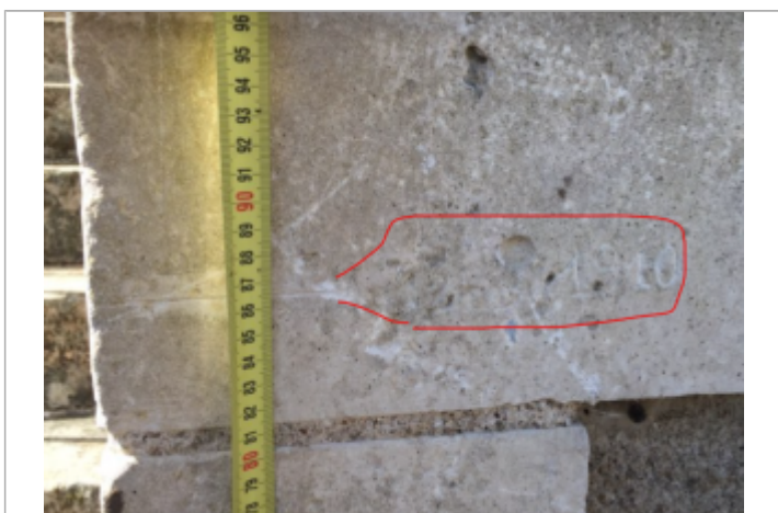
repère gravé dans la pierre : trait de niveau et date 12 mai 1910