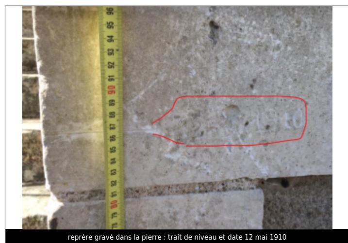
repère gravé dans la pierre : trait de niveau et date 12 mai 1910