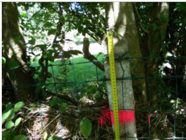
Vue rapprochée du coupe de bombe pour signaler la laisse de crue