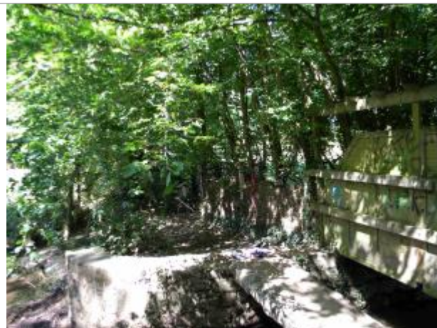
Vue de l'ensemble du guet de la Briante