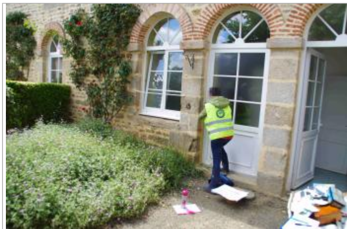
Vue complète d'une porte d'accès du domicile