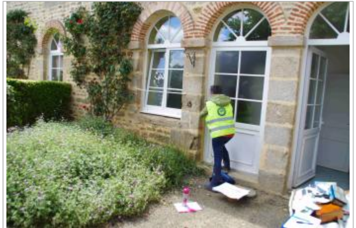
Vue complète d'une porte d'accès du domicile

Coordonnées WGS84 : X: 0.07660067 / Y: 48.43613170