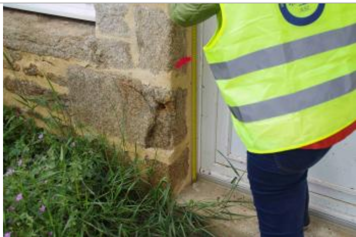
Vue rapprochée du repère sur une porte d'accès au domicile

Altitude calculée de l'eau (en m) : 137.18