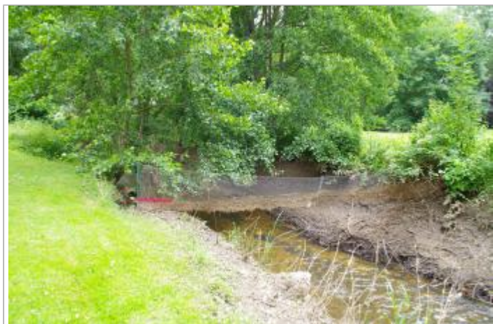
Laisse de crue sur filet au-dessus de la Briante