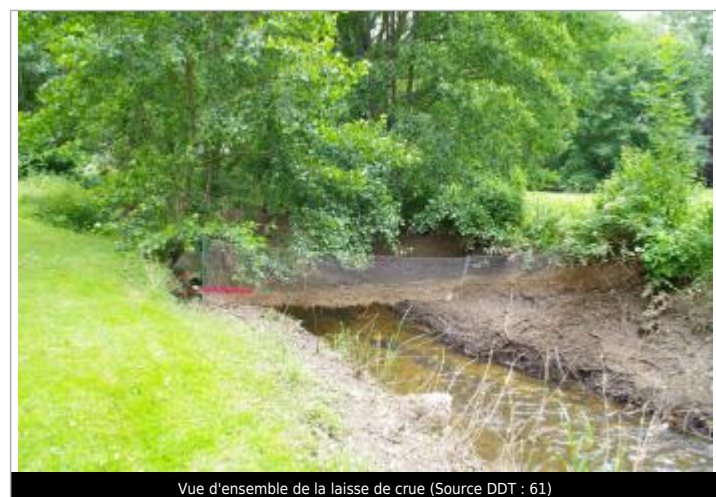
Vue d'ensemble de la laisse de crue