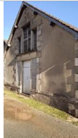
Vue sur le site