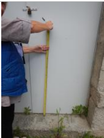
Vue entière du repérage de la laisse de crue

Altitude calculée de l'eau (en m) : 136.47 m