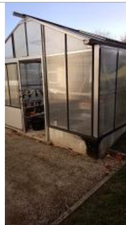
Vue sur la serre