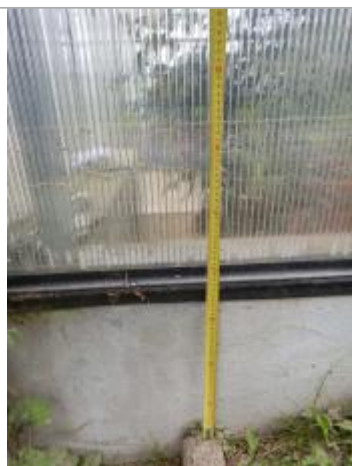
Vue de près de la laisse.