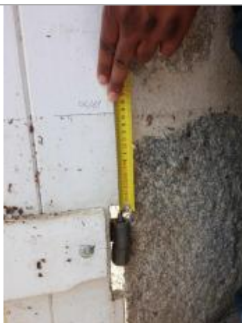
Mesure prise depuis le haut de la pointe du 1er gond en partant du sol de la porte en bois de l'appentis (source DDT 61)