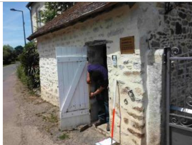
Porte en bois de l'appentis en débord d'une habitation le long de la RD 520

Coordonnées WGS84 : X: 0.01127199 / Y: 48.40054390