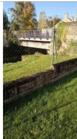
Vue sur le site