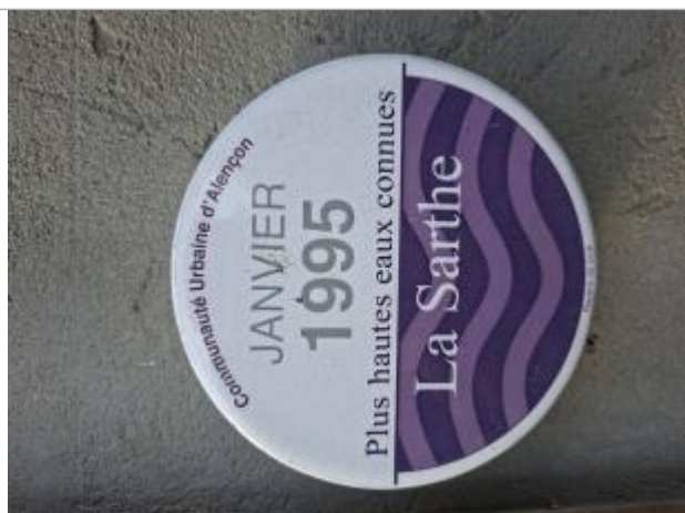
Repère de 1995

NIVELLEMENT RÉALISÉ PAR LE SPC MAINE LOIRE AVAL - 24/10/2025