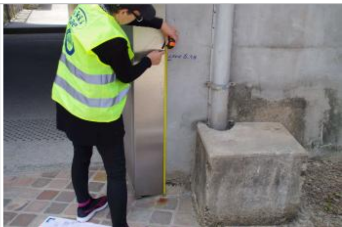
Mesure de la laisse de crue

Altitude calculée de l'eau (en m) : 131.08