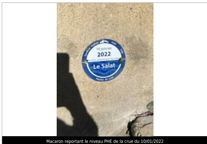
Macaron reportant le niveau PHE de la crue du 10/01/2022