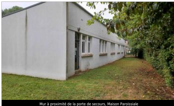
Mur à proximité de la porte de secours, Maison Paroissiale