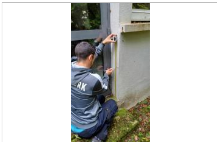
Laisse de crue inscrite sur le mur au marqueur à 52 cm/sol.

Altitude calculée de l'eau (en m) : 97.88