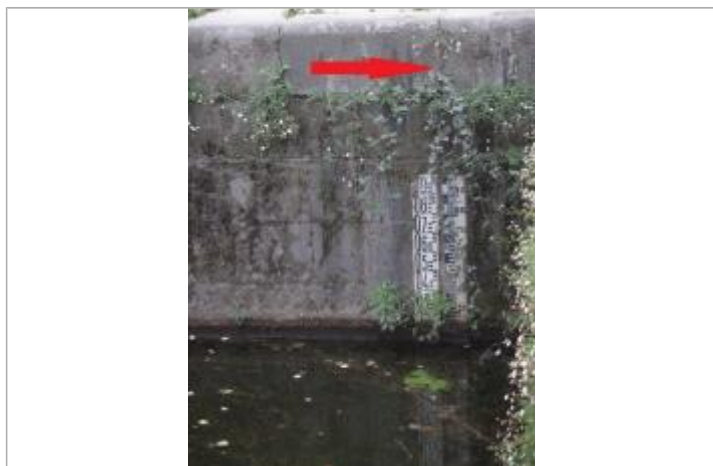
Ecluse du Mail à Rennes - échelle amont

Altitude calculée de l'eau (en m) : 25.75 m