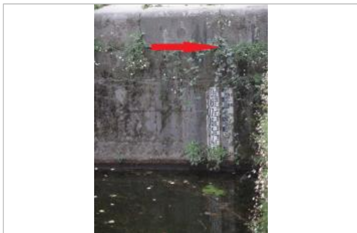
Ecluse du Mail à Rennes - échelle amont

Altitude calculée de l'eau (en m) : 25.6 m