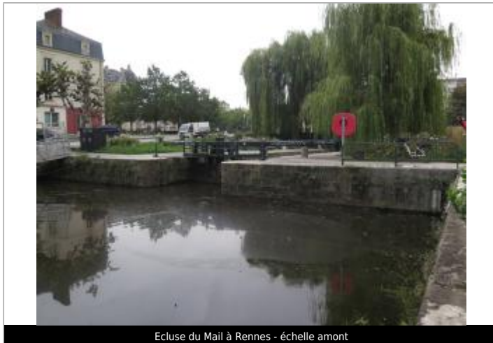
Ecluse du Mail à Rennes - échelle amont