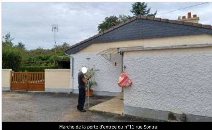
Marche de la porte d'entrée du n°11 rue Sontra